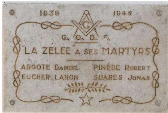
Plaque souvenir des membres de la RL.: La Zélée morts pour la France (à Fortune)