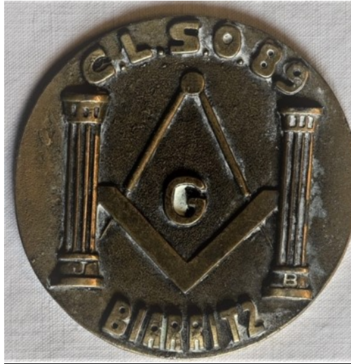
Grand orient de France

R.:L.: Thalès Orient de Biarritz - C.L.S.O. 1989